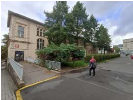
Pohled od budovy D