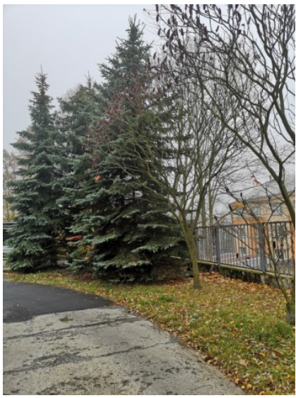
č.1-8 stromy u vjezdu