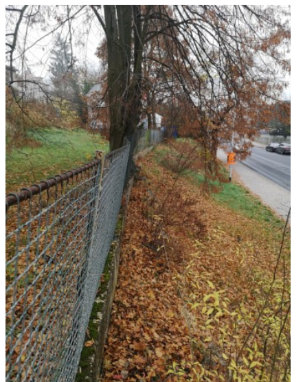
pohled-oplocení z ul. B.Němcové