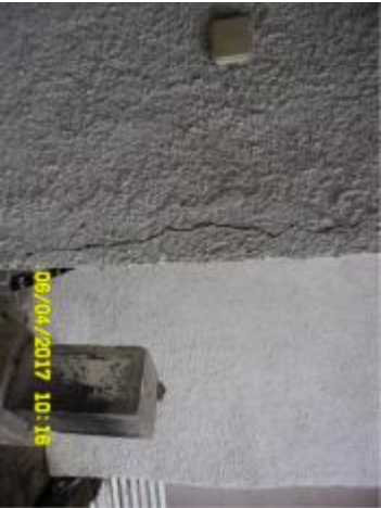
DETAILY PORUCH FASÁDY 8