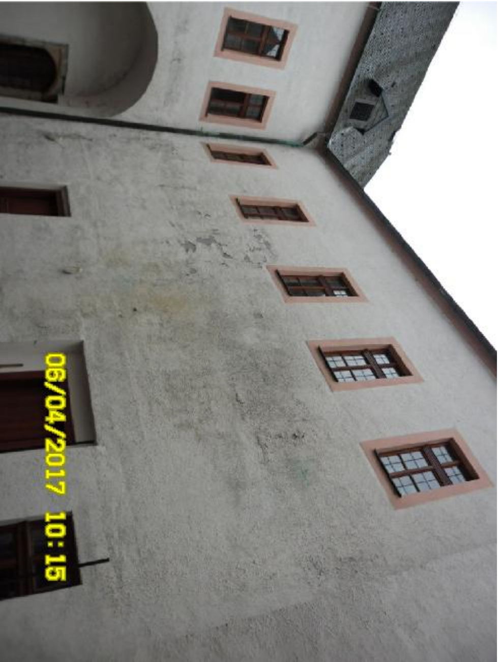
DETAILY PORUCH FASÁDY 7