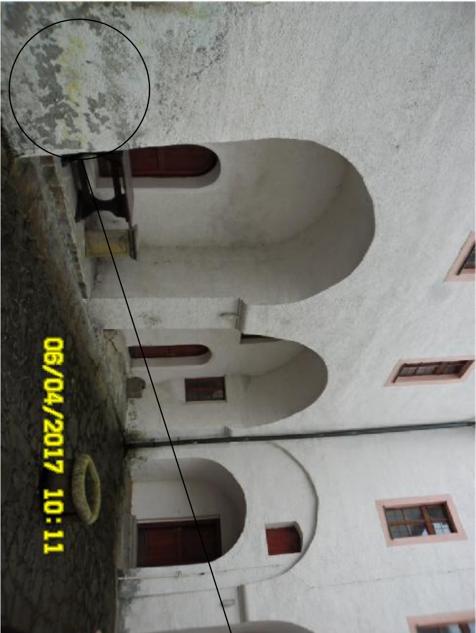
DETAILY PORUCH FASÁDY 5,6