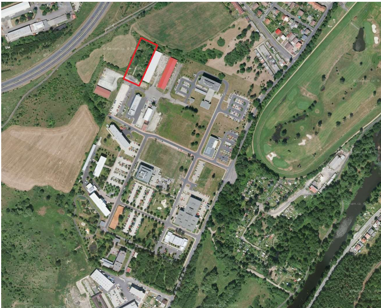
Vyznačení zájmového území v ortofotomapě