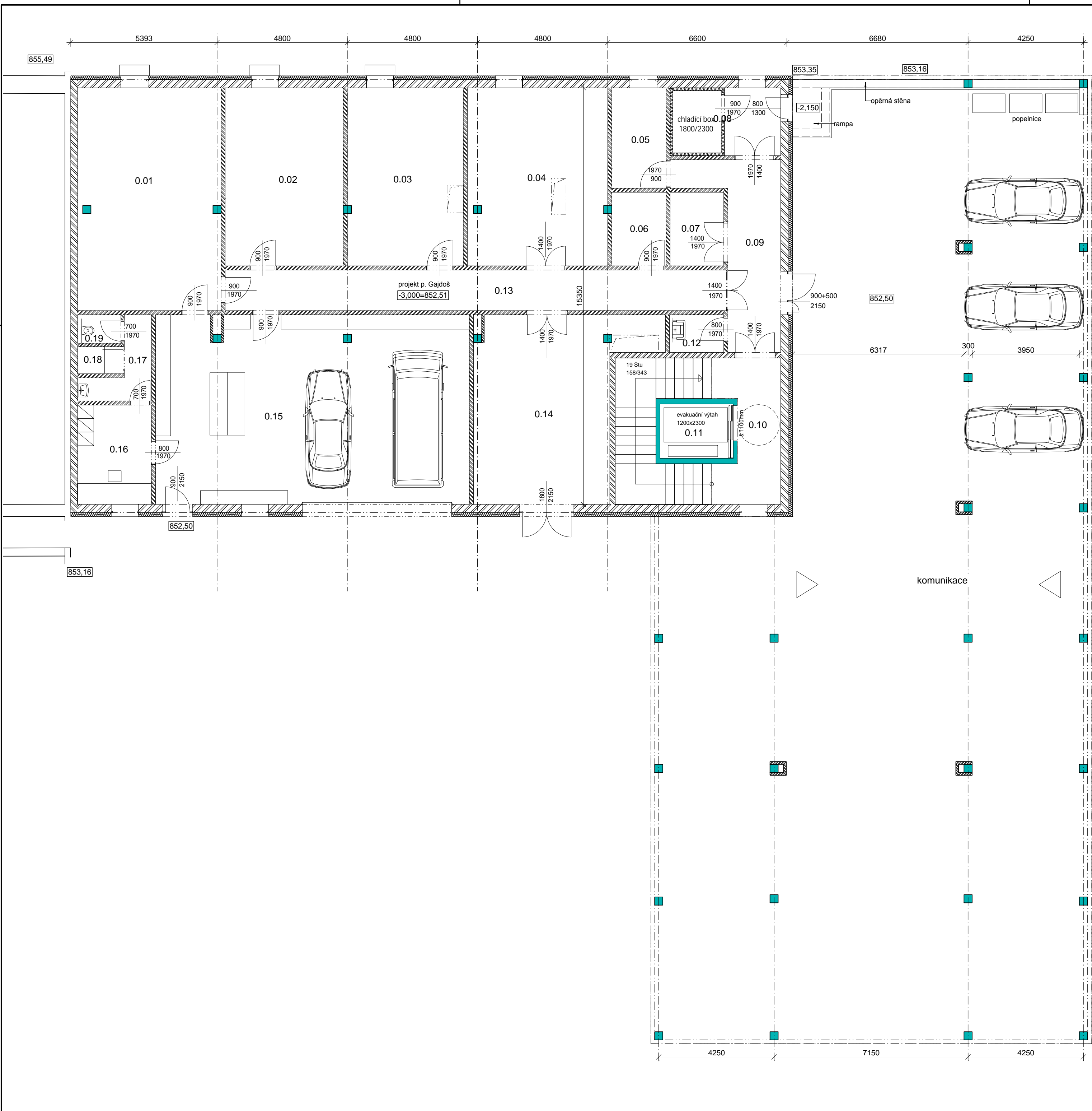
LEGENDA MÍSTNOSTÍ 1.pp