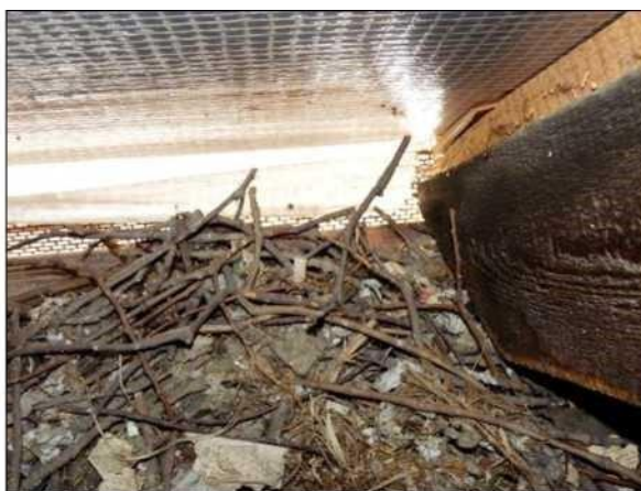
Hnízdo kavky se skládá z hrubšího materiálu, převážně větvíček dřevin rostoucích v okolí