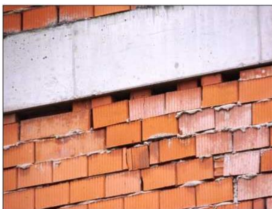
Poškození neomítnutého zdiva – obvyklý, úkryt ptáků i netopýrů