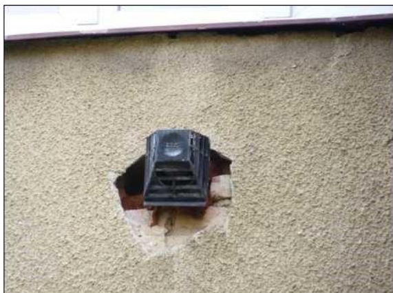
Nezačištěné okraje odvětrání podokenního hnízdiště rorýse obecného