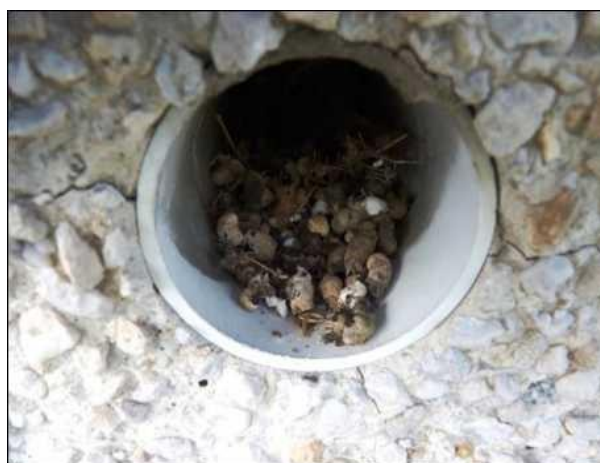
Trus drobných pěvců v ústí ventilačního otvoru