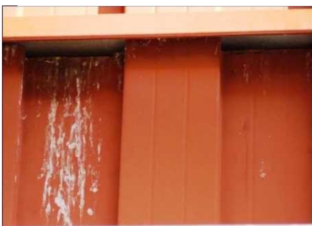
Prostor pod vletovým otvorem pěvců je často znečištěn trusem