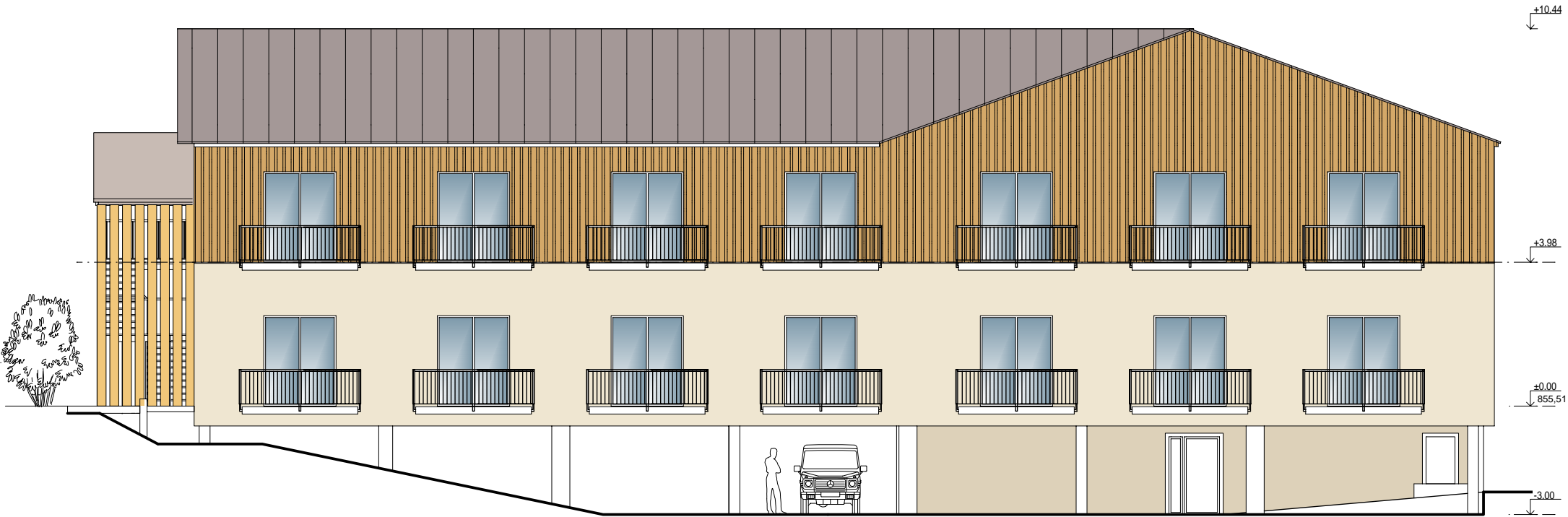
Pohled východní ( 1:150 )