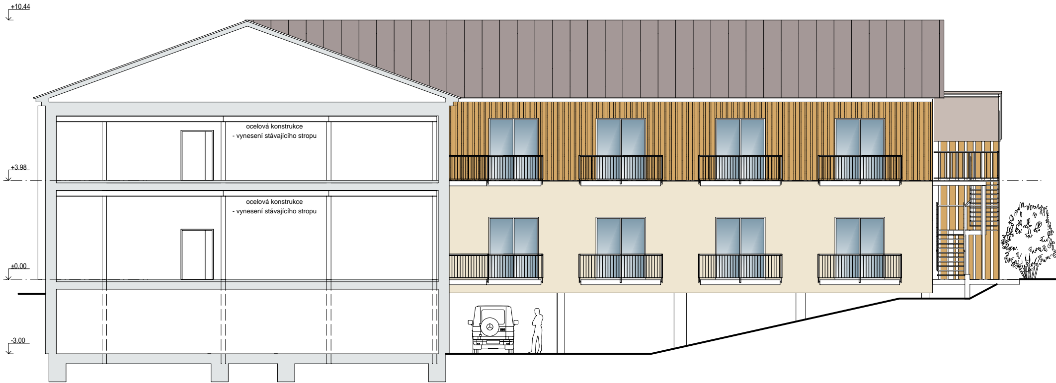
Pohled západní ( 1:150 )