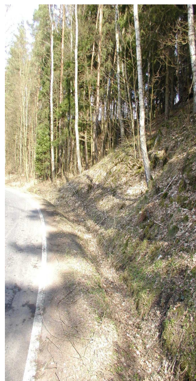
Km 1,050 vpravo