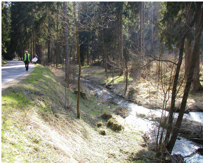
Km 0,600 vlevo