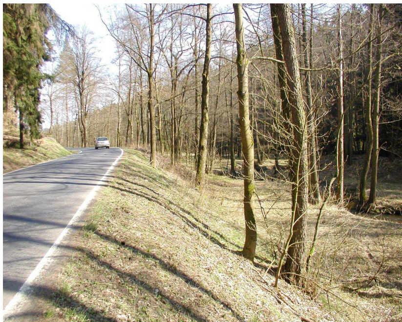
Km 0,200 vlevo