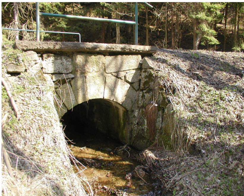
Km 0,659 pohled na výtok klenbového propustku