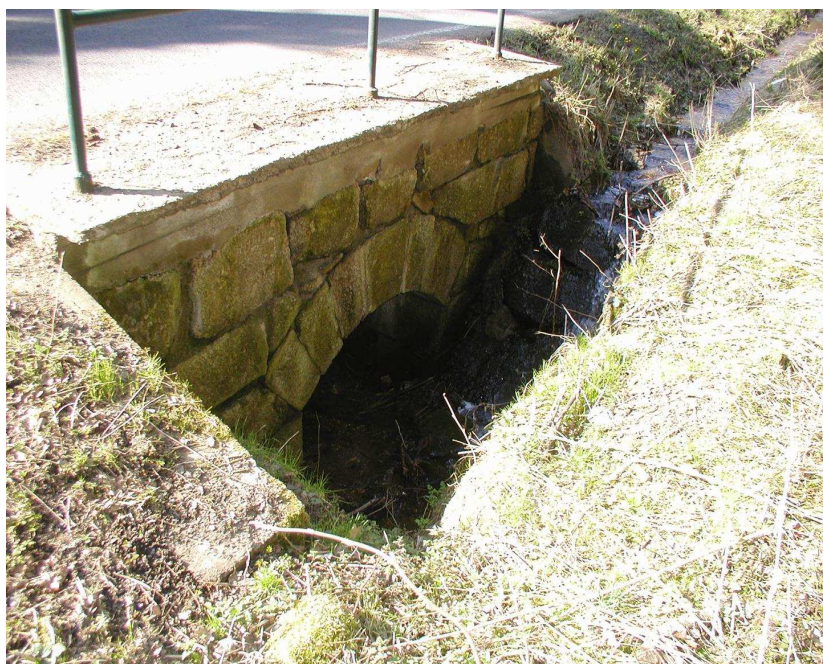
Km 0,659 pohled na vtok klenbového propustku