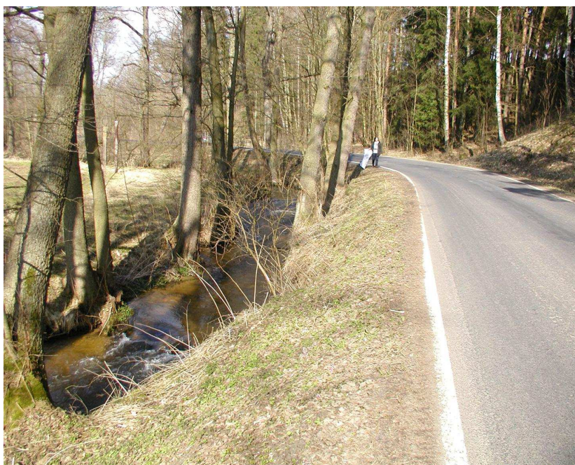
Km 1,030 vlevo