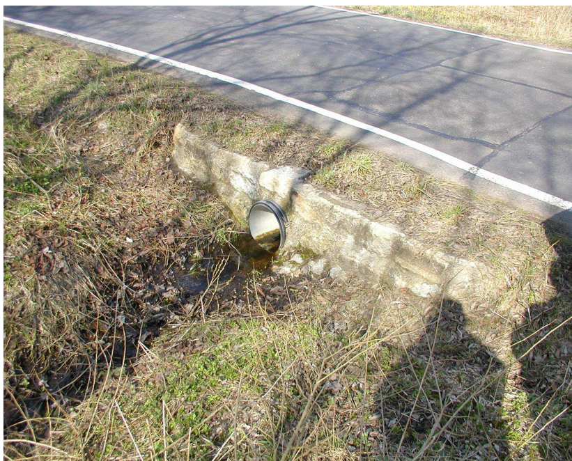
Km 1,168 pohled na výtok propustku