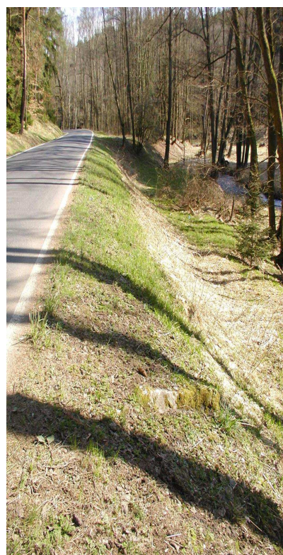
Km 0,400 vlevo