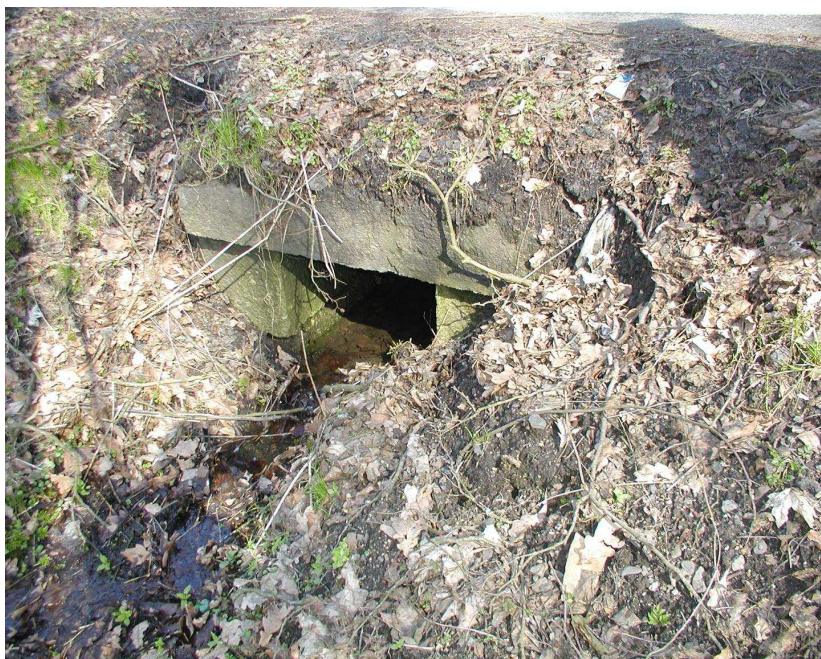
Km 1,071 pohled na výtok propustku