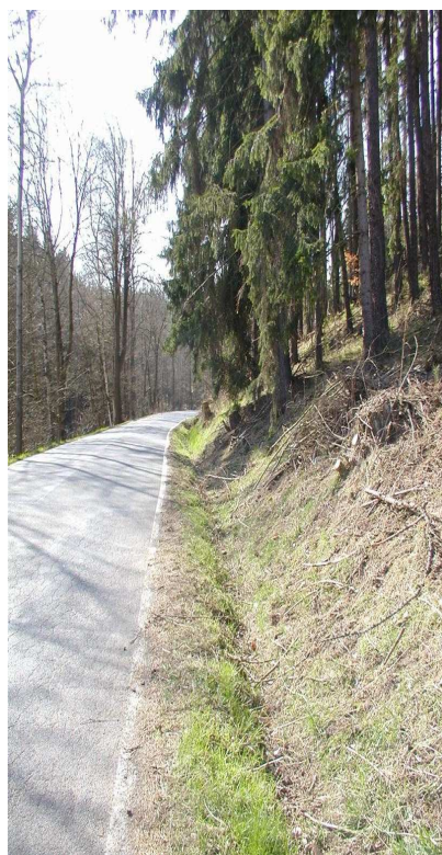
Km 0,100 vpravo