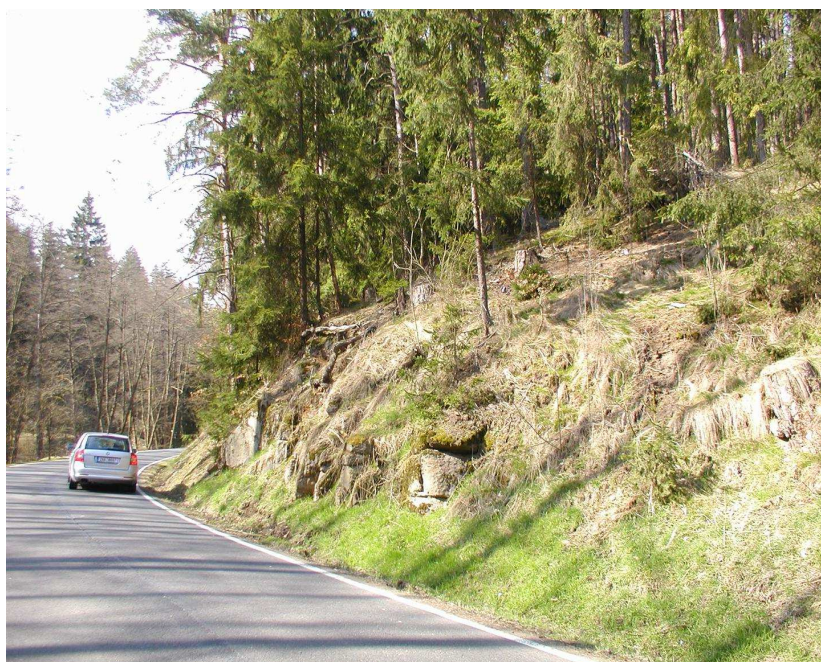
Km 0,250 vpravo