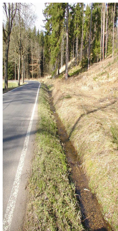
Km 0,660-0,760 příkop vpravo