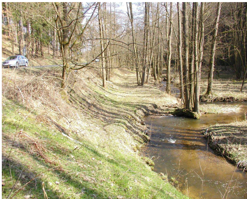
Km 0,230 vlevo