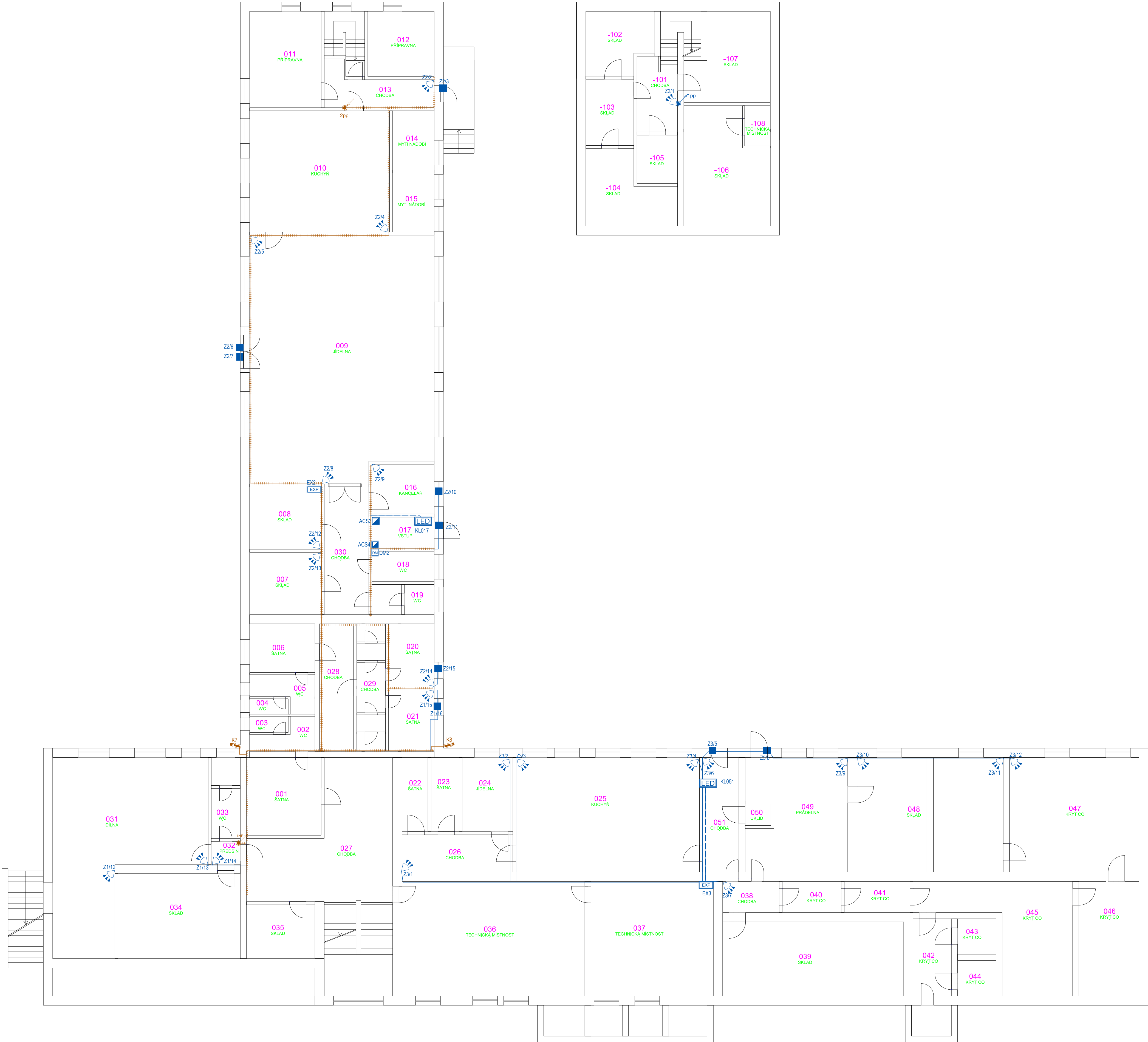
PŮDORYS 2. PP