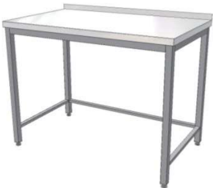
Pracovní stůl s trnoží