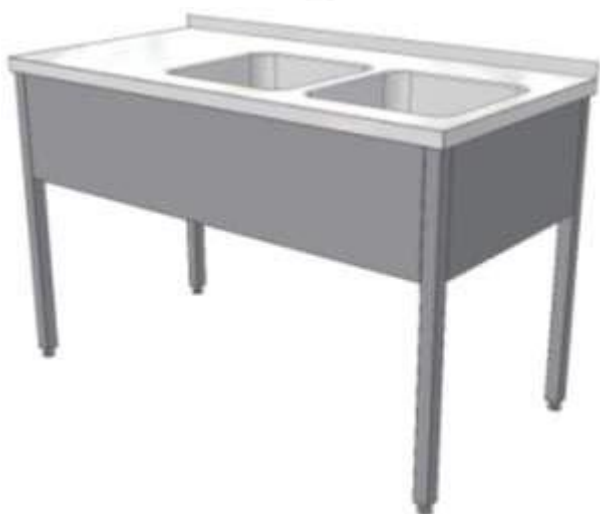
Mycí stůl s lisovanými dřezy