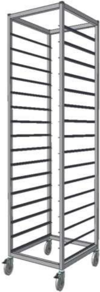
Vozík na GN, plechy, tácy nebo tablety