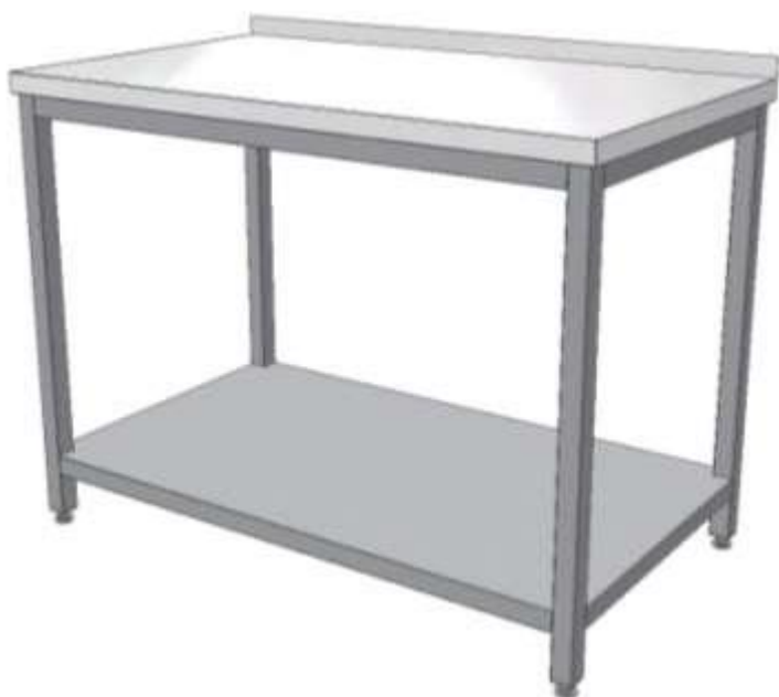
pracovní stůl s policí