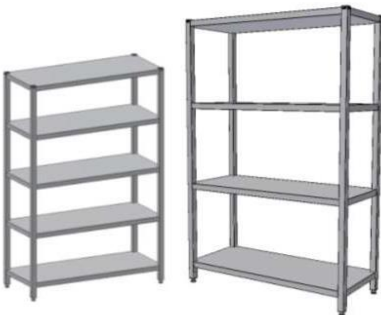
Skladový regál s plnými policemi