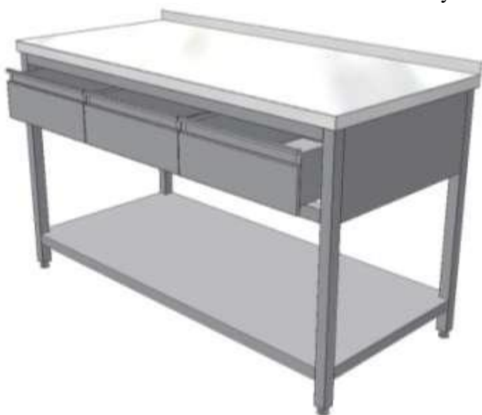
Pracovní stůl se třemi zásuvkami a policí