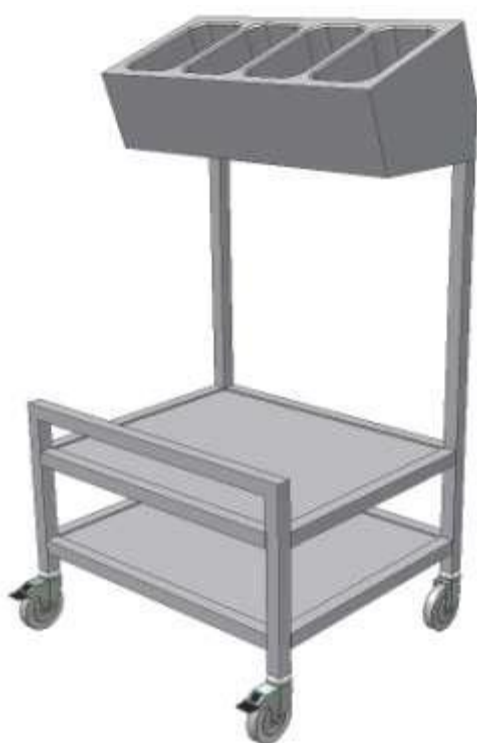
Vozík výdejní na příbory a tácy