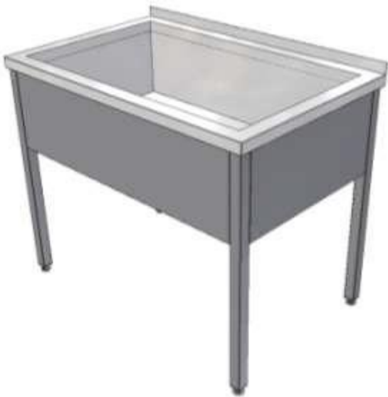
Dřez svařovaný – vana