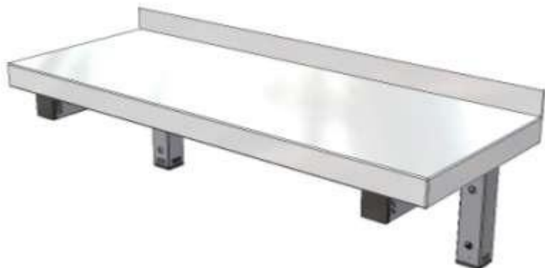
Nástěnná police jednopatrová

Dále uvádíme příklady vyobrazení obvyklých nerezových typů výrobků z kategorie nábytku: