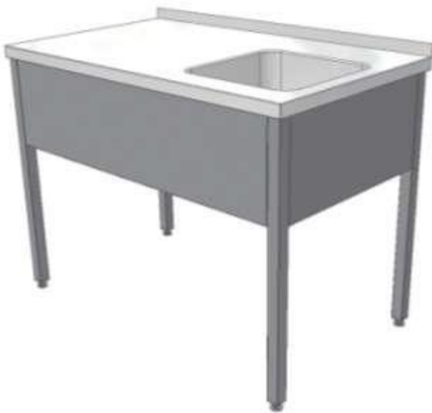
Mycí stůl s lisovaným dřezem